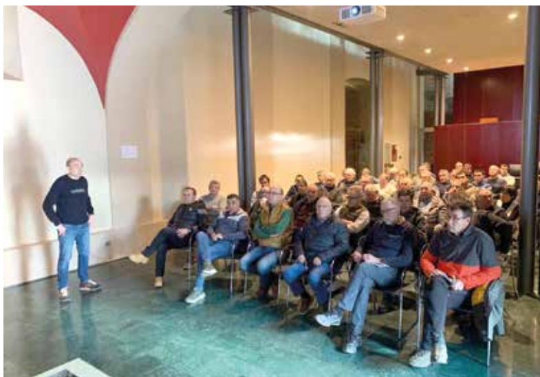
Charla territorial sobre novedades en PAC y Fiscalidad realizada en Lumbier.

Al hilo de las importaciones de terceros, el de Eslovaquia se pronuncia cortante: “La implementación de las cláusulas espejo debe considerarse como una obligación por parte de la Comisión Europea, especialmente cuando nuestra normativa no es aplicable a terceros países. Un ejemplo claro es Mercosur y la propuesta de modernización de la Directiva de Transporte Animal”.