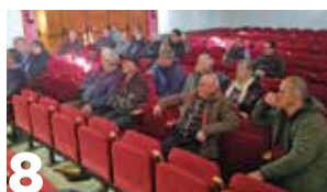
8 Aranceles de Trump: UAGN recuerda las 'aduanas' europeas