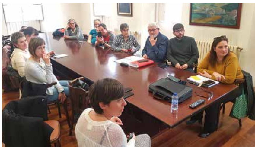
Las personas asistentes a la charla en Elizondo escuchaban atentamente las explicaciones acerca de la PAC y la Fiscalidad en el sector.