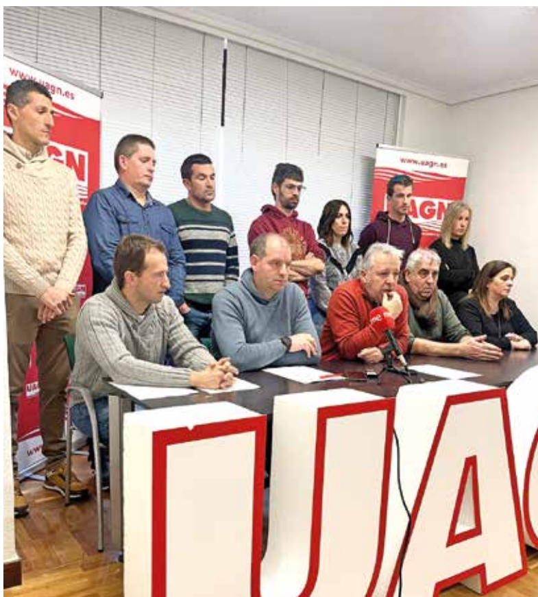
Bariáin, presidente de UAGN, explica las medidas propuestas por la organización agraria durante un momento de la rueda de prensa.