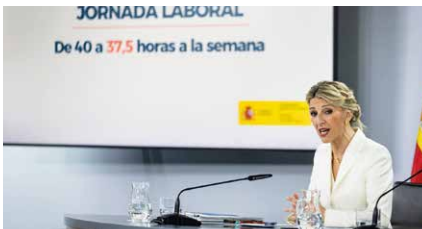
Yolanda Díaz, Ministra de Trabajo y Economía Social de España, durante el anuncio de la aprobación del Anteproyecto de Ley para la reducción de la duración máxima de la jornada ordinaria de trabajo.

Primera.- No estamos de acuerdo con la fórmula ni el procedimiento elegido para reducir la jornada a 37,5 horas semanales. Tal y como se establece en el punto 1 del art. 34 la jornada anual debe ser la pactada en los convenios colectivos como hasta ahora venía regulado. Pero en todo caso debe contemplarse que las empresas, sobre todo aquellas que tienen picos de trabajo estacionales, como son las agrarias, puedan establecer una mayor flexibilidad de modo unilateral sin tener que abrir ningún periodo negociador. Debe seguir contemplándose que hay sectores, como el agropecuario, en los que deben seguir contemplándose la realización de jornadas especiales y que para establecerlas no sea preciso más que la decisión empresarial justificada y por tanto exista una flexibilidad acorde a las