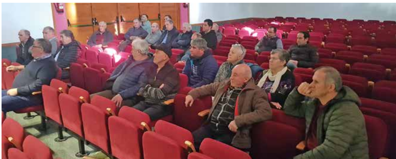
Profesionales del sector primario durante la charla sobre las novedades en PAC y en Fiscalidad realizada por UAGN en Ezcároz.