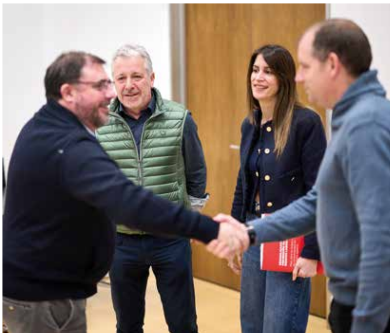
Primer encuentro, con el presidente del Parlamento, para presentar la estrategia sindical entre las instituciones.

Es hora de contabilizar y pagar la captura de CO2, con una normativa clara que remunere al agricultor y al ganadero en su labor de descontaminación por el mantenimiento de cultivos y pastos