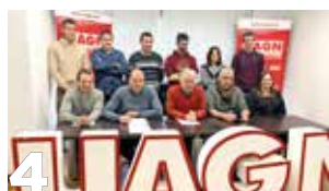
4 Navarra, la marca que quiere UAGN