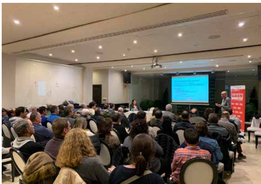
Charla sobre novedades en PAC y Fiscalidad realizada en Tudela.

Las notificaciones se enviarán por correo electrónico a quienes tengan su dirección actualizada en el portal de la Seguridad Social 'Importass'. Para descargar las notificaciones, será necesario contar con una clave permanente o un