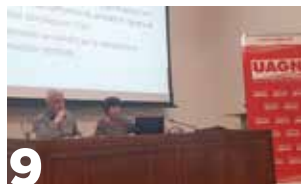
9 Charlas sobre novedades en PAC y Fiscalidad