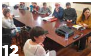
12 Reuniones para trabajar la PAC 2027