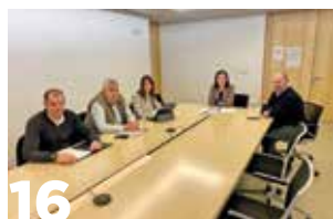
16 UAGN busca soluciones a la situación medioambiental