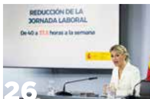
26 Alegaciones a la Ley de reducción de la Jornada laboral