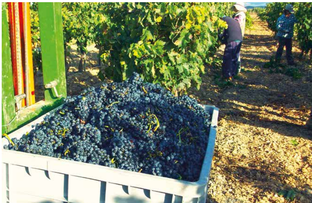
Profesionales del sector trabajando durante la vendimia.

exenciones específicas únicamente se establecerán en los casos y en la medida en que sean necesarias para abordar problemas específicos en la aplicación de dichas normas y no obstaculizarán de manera significativa la contribución de cada una de esas normas a sus objetivos principales.