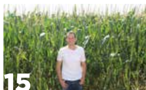
15 UAGN pide frenar el crecimiento de importaciones de maíz dulce de China