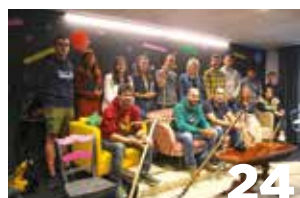
24 Más acciones y participación en 'Agroinfluencers' II