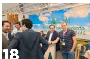
18 UAGN, en la reunión sectorial de bovino