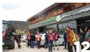
12 UAGN insta a Gobierno Foral a convocar la mesa fiscal