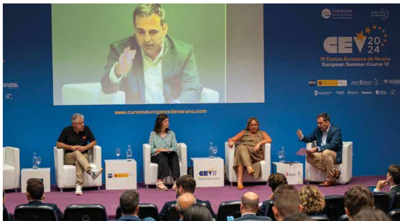
Un momento de la mesa redonda.