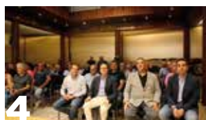
4 UAGN, por la construcción de la II fase del Canal de Navarra