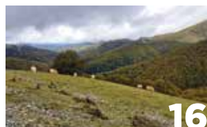
16 UAGN, contra las nuevas normas de nutrición sostenible del suelo agrario