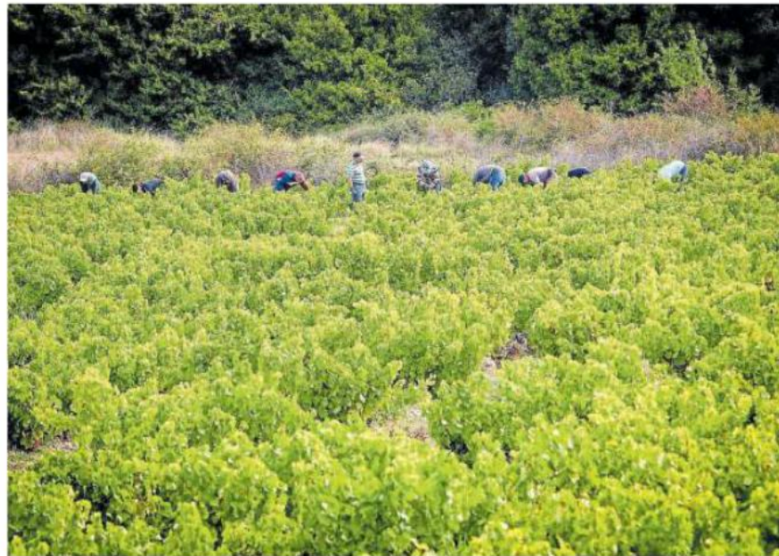
Vendimiadores en una campaña anterior recogen la uva.

Aierdi destacó que, con las medidas excepcionales en las dos convocatorias anunciadas, el Gobierno foral "contribuye a aportar un aliento importante al sector vitivinícola ante las dificultades específicas que atraviesa en una determinada coyuntura, pero sin perder la perspectiva de que se necesitan soluciones a medio plazo que probablemente pasen por fórmulas como la reconversión varietal -hacia el rosado y el blanco en detrimento del tinto-, mejorar la calidad,