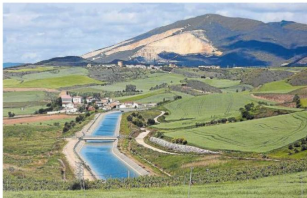
El Canal de Navarra, a su paso por Tirapu.

Así concluyó la asamblea ordinaria de la Comunidad General de Regantes del Canal de Navarra el viernes 19 de abril, a la que asistió el