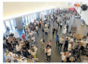
21 bodegas ofrecen cien marcas en Balaarte.

COYUNTURA - El Índice de Precios de Consumo (IPC) subió un 1% en marzo respecto al mes anterior y la tasa interanual se sitúa en la Comunidad Foral en el 3,4%, según los datos publicados ayer por el Instituto Nacional de Estadística (INE). En lo que va de año, los precios han crecido en Navarra el 0,9%. En España, el IPC subió un 0,8% en marzo respecto al mes anterior y elevó cuatro décimas su tasa interanual, hasta el 3,2%, debido al encarecimiento de la electricidad por la subida del IVA de la luz, de los carburantes y de los paquetes turísticos, que incrementaron sus precios coincidiendo con Semana Santa. - Diario de Noticias