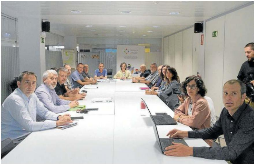
Reunión de la Mesa de la Sequía este martes en el departamento de Desarrollo Rural.