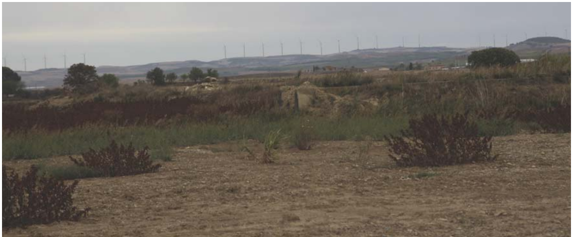
Situación en la que se encuentra la zona de Peralta, donde debería estar constuido el ramal del Canal de Navarra