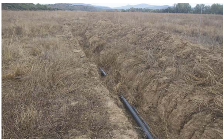
En estas imágenes se puede observar como está la zona de Murillo el Fruto.

El periplo comienza cuando al Ayuntamiento de Murillo el Fruto se le concede una subvención del Departamento de Desarrollo Rural para abastecer de riego las 150 hectáreas, en marzo de 2017.