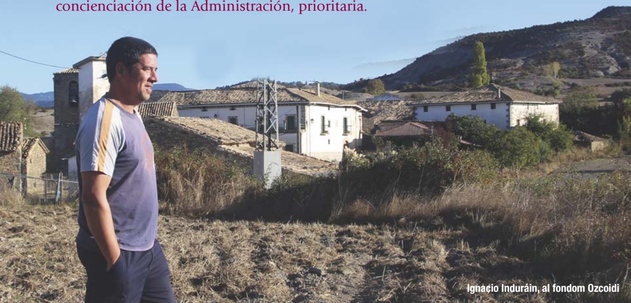
Ignacio Induráin, al fondom Ozcoidi

Aunque se encuentran con muchas dificultades, los jóvenes quieren seguir viviendo en las zonas rurales. Necesitan la concienciación de la Administración, prioritaria.