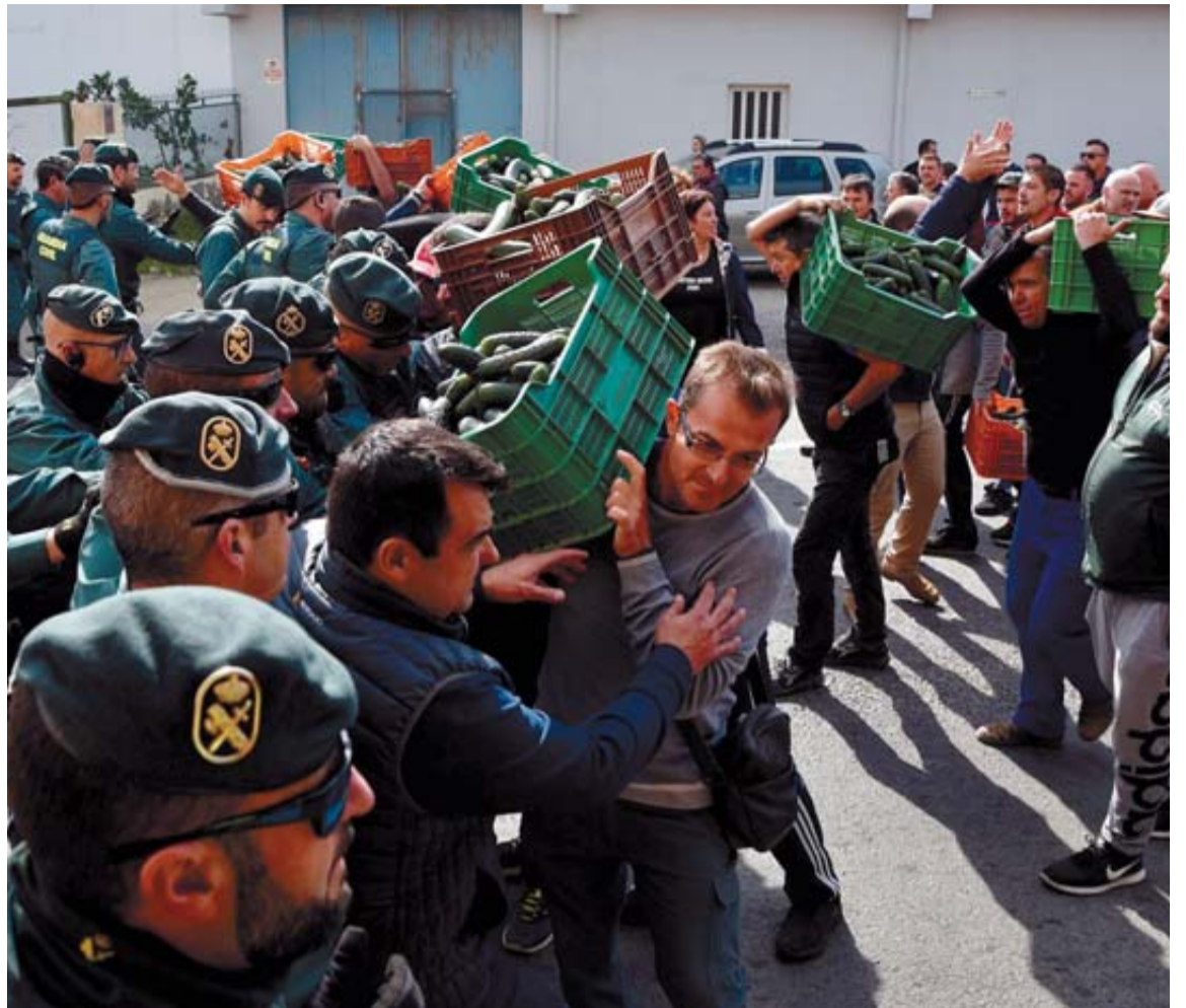
Protesta de los agricultores registrada ayer en El Ejido (Almería).