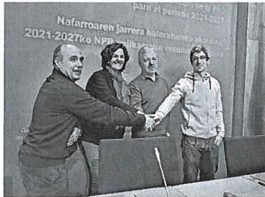
La consejera con representantes de UAGN, EHNE y UCAN. CALLEJA

"Para avanzar -dijo Gómez- es necesario un acuerdo político para que el Ministerio defina ya lo que consideramos lo principal: el modelo de aplicación de la PAC, que elimine los derechos históricos, que priorice al agricultor personal, que defienda la explotación familiar agraria o que promueva producciones agrarias sosteni-