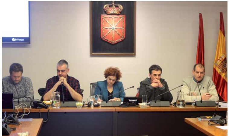
Durante la sesión de trabajo

“Yo soy ganadero del valle de Salazar, y os puedo afirmar de primera mano que a los ganaderos de nuestro valle no nos ha convocado a ninguna reunión ninguna vez el Departamento para informarnos ni antes de la suelta, ni después. UAGN se reunió con la consejera el 16 de octubre, le pidió una reunión con los ganaderos de los valles y aun no se ha reunido con nosotros. Sabemos que las osas las ha soltado Francia, Navarra no ha sido la au-