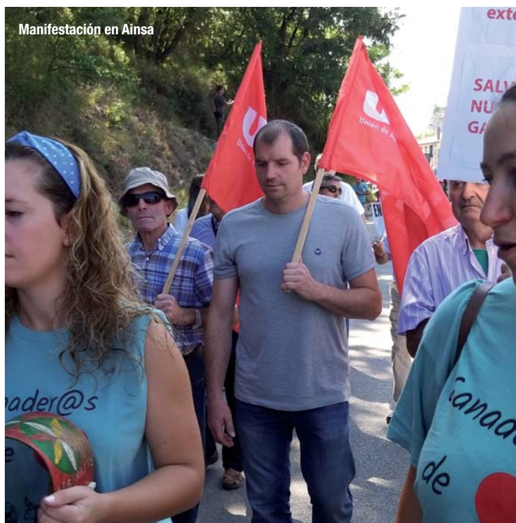
Manifestación en Ainsa

Siguió “La semana pasada la señora Consejera compareció en esta comisión y se dijo que todas las medidas que se están llevando a cabo son maravillosas y todos los ganaderos estamos encantados con ellas. Discrepamos bastante ella. Según las cifras aportadas por ella, no se han sumado muchos ganaderos a muchas de ellas. La que más aceptación han tenido han sido los geolocalizadores del rebaño y los avisos por sms. Pero aún así las geocali-