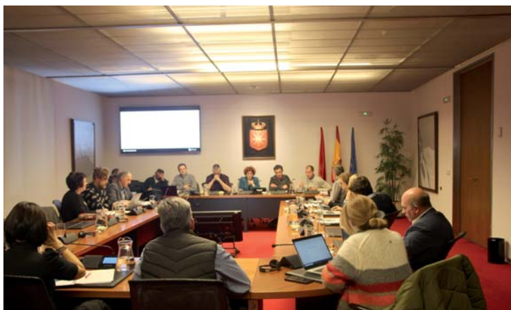
Durante la sesión de trabajo

hacer es ver cuántos animales faltan, cuántos hay heridos y después tiene que encontrar los animales muertos y valorar la situación, ya que si no encuentras los cadáveres no cobras. Ha ocurrido que después de un ataque, un ganadero buscando los cadáveres, la osa le ha rugido entre la maleza. Esto pone en riesgo al ganadero. En la comparecencia se decía que las indemnizaciones son altas, pero ¿a cuánto se paga la tranquilidad del ganadero? Cómo vivimos sabiendo que nos metemos a la cama y al día siguiente no vamos a saber si tenemos a nuestro ganado, que nos nuestro medio de vida. Y posteriormente que tengamos que estar buscando los cadáveres porque si no se nos indemniza, ¿eso cuánto val?, y si no