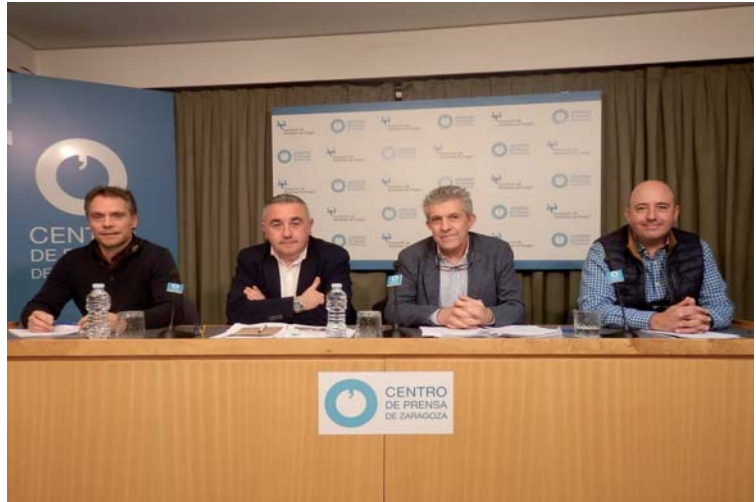
Durante la rueda de prensa celebrada el 26 de diciembre en Aragón

Las organizaciones agrarias han puesto de manifiesto que tras más de 5 años de los efectos del 'veto ruso', y de multitud de reuniones y debates técnicos, la actuación de las administraciones competentes ha sido nula ya que siguen sin ponerse en marcha medidas que podrían evitar el progresivo descenso de las explotaciones y los bajos precios. Es de destacar que en este periodo en el Valle del Ebro