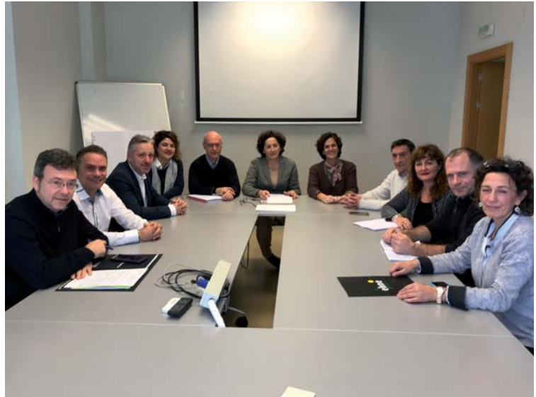
Durante la primera reunión celebrada el 19 de diciembre

UAGN lleva la gestión laboral y asesora de forma directa a más de 1.000 empresas