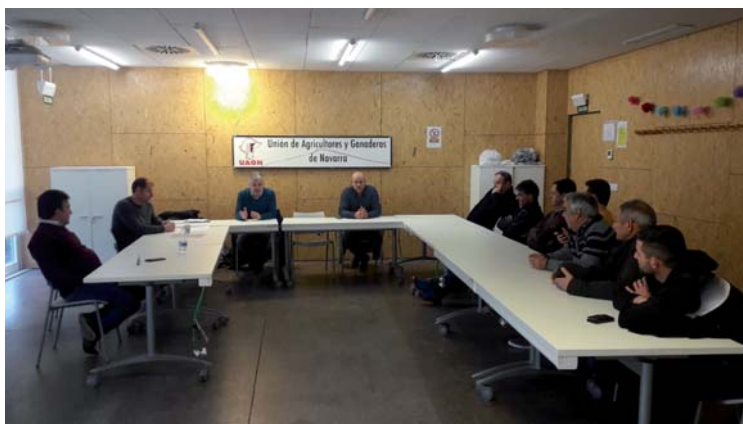
Durante la reunión el lunes 20 de enero en Pamplona

La IGP Ternera de Navarra no certificará este canal porque no lo permite la normativa