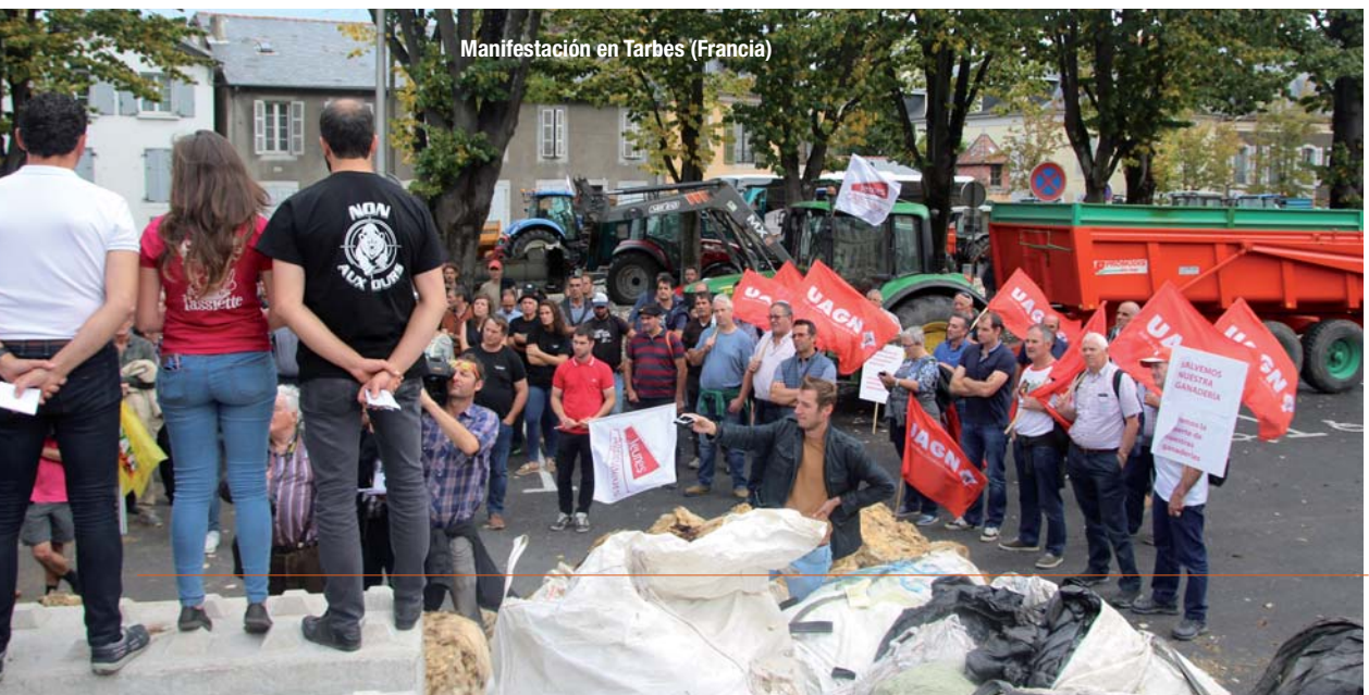
Manifestación en Tarbes (Francia)

Continuó “Y lo digo con conocimiento de causa. Cuando se produce un ataque al ganado, el ganadero lo primero que tiene que