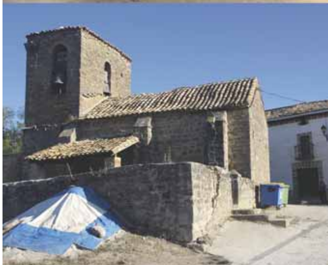
Ozcoidi es una localidad del valle de Urraul Alto, en la Merindad de Sangüesa. Esta zona es una de las más despobladas de Navarra, a ambas fotos les separan algo más de 40 años, en la de abajo, Ignacio Induráin y en la de arriba sus abuelos. “Hace unos 70 años, había unas siete u ocho familias y había escuela, e incluso una taberna. Ahora, tan solo una familia”.