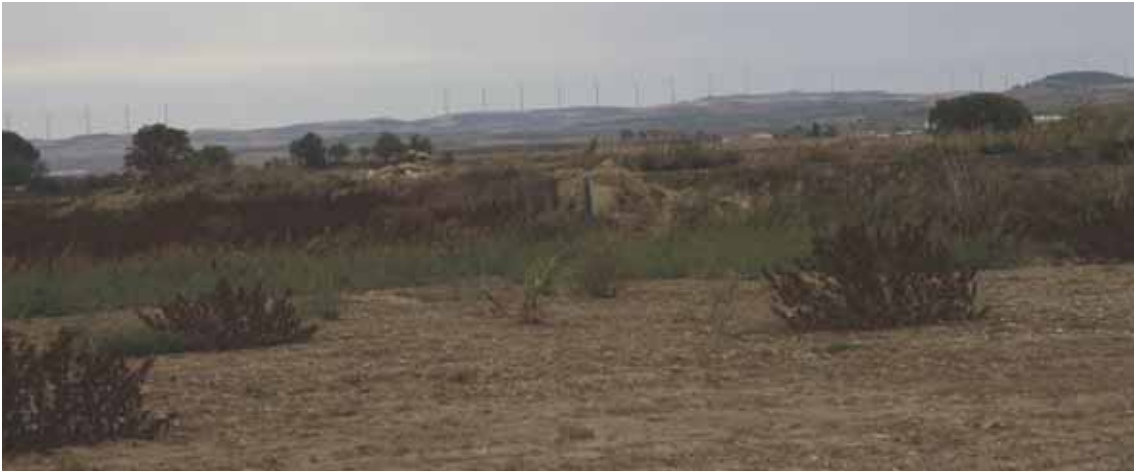
Situación en la que se encuentra la zona de Peralta, donde debería estar constuido el ramal del Canal de Navarra