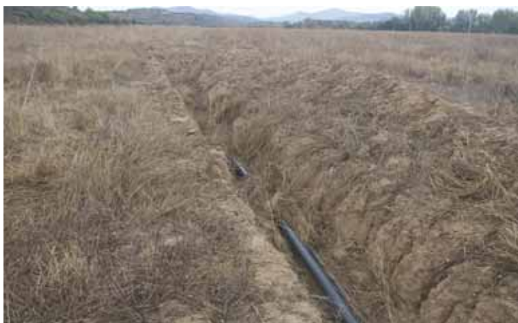
En estas imágenes se puede observar como la zona de Murillo del Fruto.

El periplo comienza cuando al Ayuntamiento de Murillo el Fruto se le concede una subvención del Departamento de Desarrollo Rural para abastecer de riego las 150 hectáreas, en marzo de 2017.