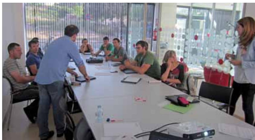
Asistentes en el taller de Finanzas para Sobrevivir de Tudela el 31 de mayo

En los talleres de marketing relacional se quiso lograr que el participante fuese capaz de determinar las habilidades de liderazgo emocional a las circunstancias de su trabajo y aplicar un método de comunicación empática y asertiva en sus relaciones sociales y profesionales. Con las técnicas de negociación se bus-