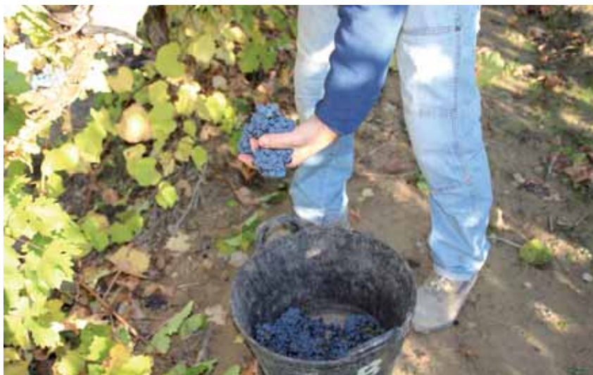
Este sistema de reparto no es el camino adecuado para una reestructuración

Tal como establece la normativa comunitaria, España debe autorizar anualmente entre el 0% y el 1% de la superficie plantada de viñedo a nivel nacional (958.697 hectáreas) y el Ministerio aprobó para este año un 0,43%, es decir, 4.173 has en los próximos tres años, aunque tanto la DOC Rioja como la DO Navarra hicieron uso de la posibilidad de solicitar limitar ese número de hectáreas en sus respectivos territorios, quedando