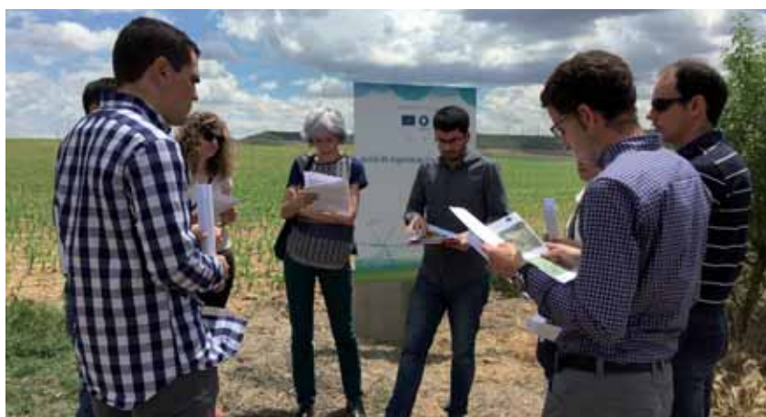
Para finalizar la reunión se visitó una de las parcelas del proyecto