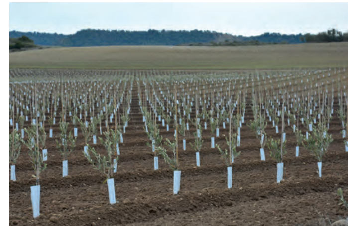
Plantación de olivar en seto en secano de Agroganadería Sierra de Luna en Gurrea de Gallego

La inscripción se realizará en el siguiente enlace: https://bit.ly/2pKT50L