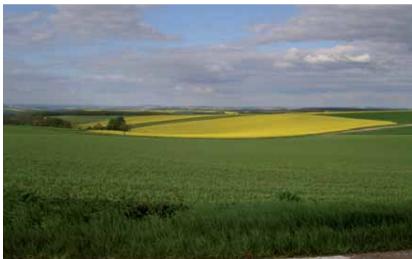
Los cultivos transgénicos permitidos son maíz, colza, soja, algodón y remolacha azucarera

España es el segundo productor comunitario de carne y exportó en 2015 a la UE por valor de 6.265 millones de euros , lo que representa el 1,5% del PIB estatal. Toda la UE, incluida España, es muy deficitaria en proteína vegetal, especialmente soja. La producción mundial de soja en 2014 estuvo en torno a 320 millones de toneladas, mientras que la producción global de la UE rondó los 1,34 millones de t , de las que únicamente 3.000 t se cultivaron en España, es decir, el 0,22% de la UE y el 0,0009% a nivel mundial. ( sigue... )