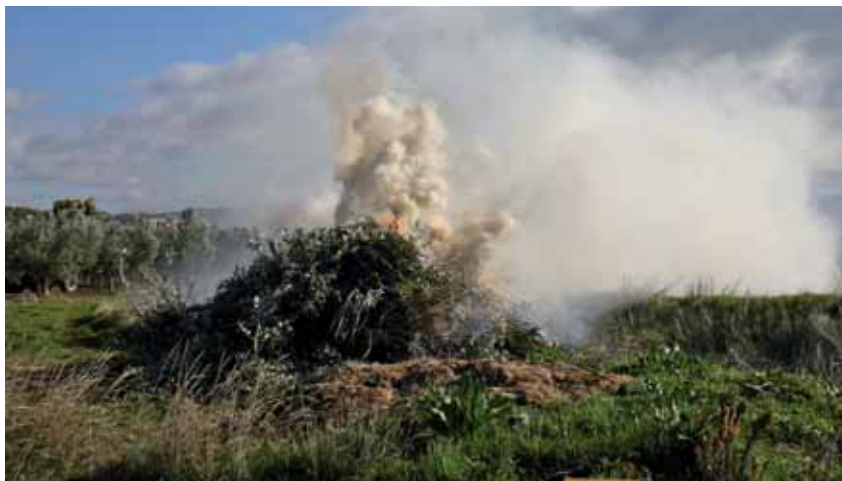
Queda prohibido el uso del fuego para infraestructuras agrícolas artificiales en período estival