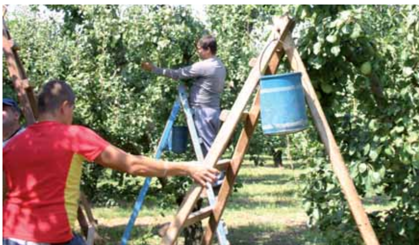
Se está llevando a cabo una campaña de control de los contratos de compraventa

El Plan de Control plantea un plan para comprobar la existencia de contratos