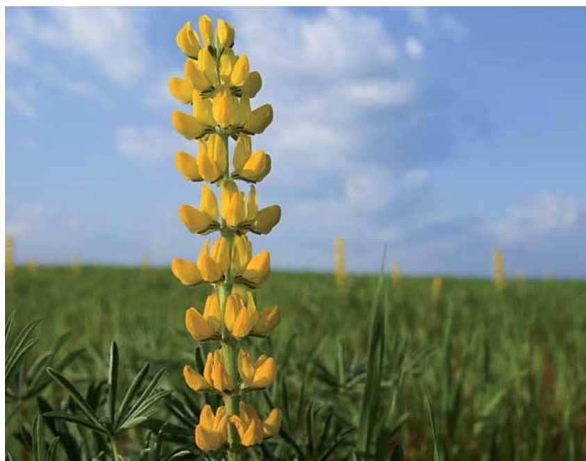
No sería viable sustituir la soja por otros cultivos energéticos

¿Si la UE permite la importación por qué no permite la producción?