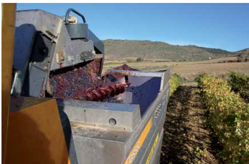
Actualmente la producción media supera los 42 millones de hectolitros

Es de significar que el consumo de vino en España se estima en torno a 10 millones de hl lo que pone de relieve nuestra necesidad imperiosa de exportar. España es líder mundial en volumen de vino exportado con 24 millones de hl , de los que más de la mitad fueron graneles que tuvieron como destino Francia e Italia. El precio medio de venta fue de 1,10 €/litro ya que los graneles