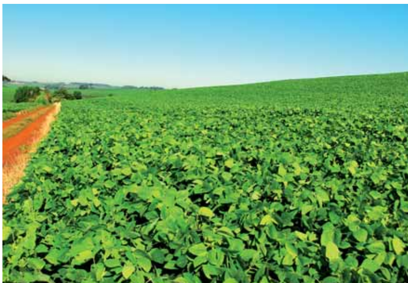
Preocupación entre nuestros ganaderos si se restringen las importaciones de soja transgénica

Y en la última 2015, según datos oficiales del Ministerio de Agricultura, la superficie total destinada en España al cultivo del maíz transgénico (MON 810) fue de 107.749 hectáreas, de cuales 6.620 has , se sembraron en Navarra. La región europea que concentra mayor superficie destinada a su cultivo es Aragón con 42.611 has , casi el 40% del total estatal, y le sigue Cataluña con 30.790 has . En el conjunto del Valle del Ebro se concentra prácticamente el 90% de la superficie española destinada a este maíz transgénico; y ese