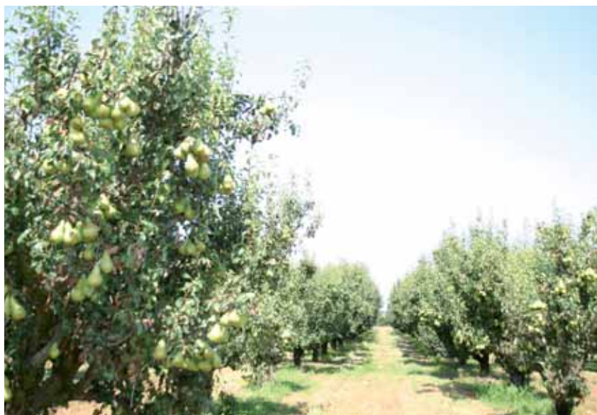
El objetivo del paquete es reequilibrar el balance entre oferta y demanda

2- Ayudas directas. Será una ayuda condicionada al cumplimiento de determinados compromisos ligados a la estabilidad de los mercados y contará con un montante de 350 M€, repartidos entre los Estados miembros,