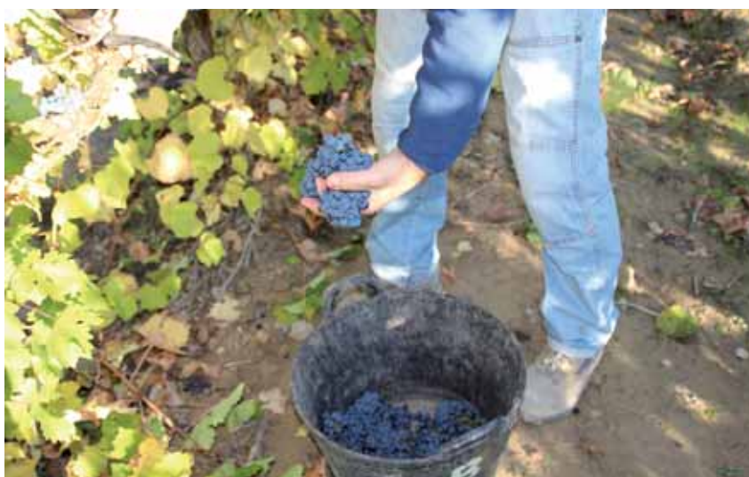
Este sistema de reparto no es el camino adecuado para una reestructuración

Tal como establece la normativa comunitaria, España debe autorizar anualmente entre el 0% y el 1% de la superficie plantada de viñedo a nivel nacional (958.697 hectáreas) y el Ministerio aprobó para este año un 0,43%, es decir, 4.173 has en los próximos tres años, aunque tanto la DOC Rioja como la DO Navarra hicieron uso de la posibilidad de solicitar limitar ese número de hectáreas en sus respectivos territorios, quedando