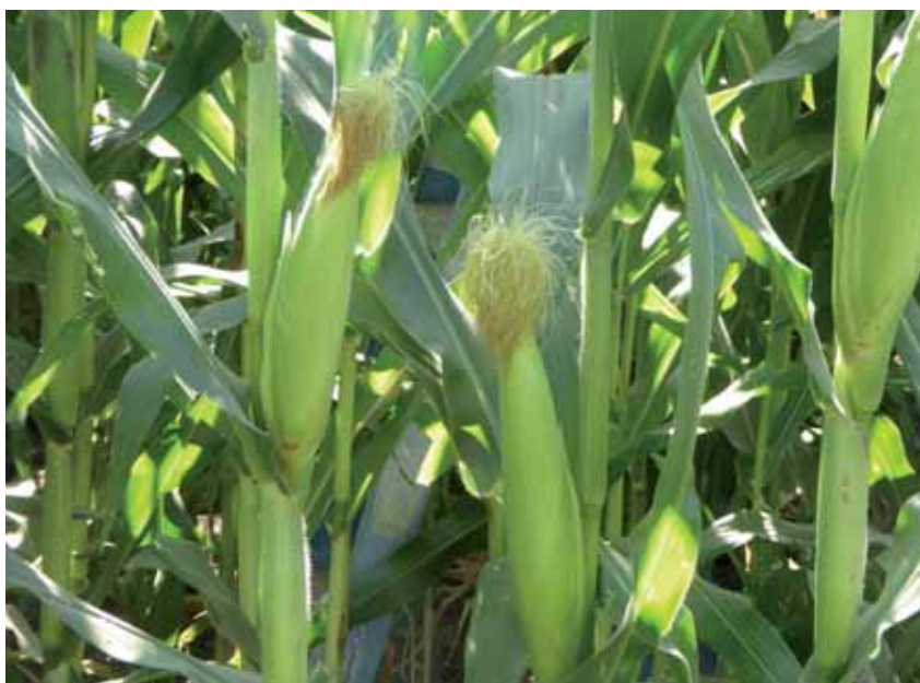
En Europa se autorizó desde 1998 el cultivo de maíz MON 810

En la Unión Europea solo está autorizado el cultivo del maíz MON 810