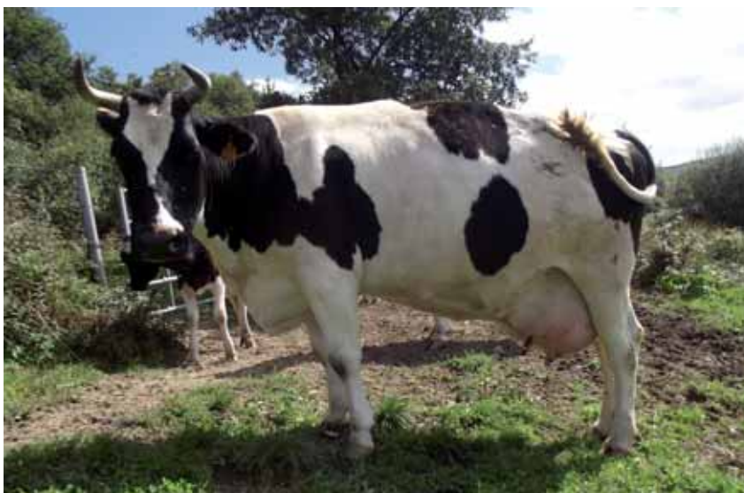
Una de las medidas es la reducción voluntaria de la producción

El objetivo global es, teóricamente, una disminución total de