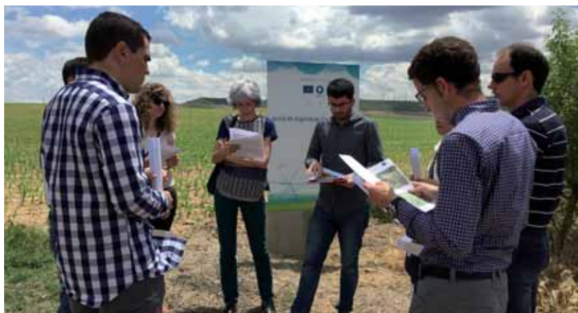
Para finalizar la reunión se visitó una de las parcelas del proyecto