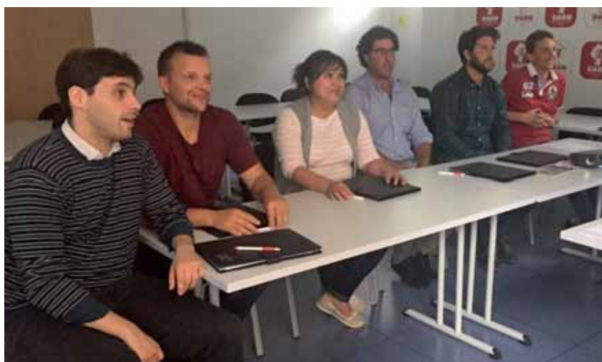
Charla de Marketing Coste 0 celebrada en Estella el 26 de mayo

El acompañamiento al joven agricultor y ganadero se ha convertido en uno de los principales retos de la organización. Por ello, se han llevado a cabo estos talleres, las jornadas sobre la Seguridad Social realizadas en junio y se van a programar para el próximo otoño unos cursos entorno a la iniciación de la actividad agraria.