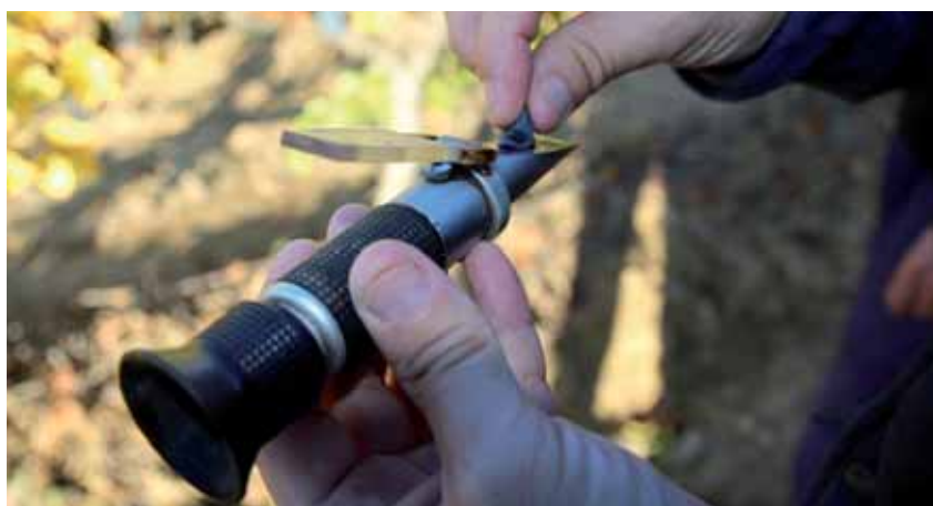
El Ministerio ha comunicado la autorización desde la desaparición del antiguo régimen

Resulta obvio que si se pretende una reestructuración y un redimensionamiento para dar viabilidad económica a las explotaciones y a nuestras DOC Rioja y DO Navarra este sistema de reparto no es el camino adecuado ya que los viticultores profesionales se han