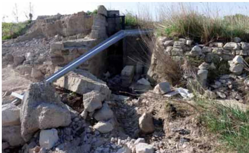
43 municipios solicitaron ayuda por los daños en las infraestructuras municipales

Al cierre de Tempero los servicios técnicos de UAGN han verificado que hay un error en la convocato-